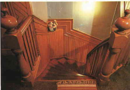
"Bergön", Utkiksbacken 24.

Moderniserad rumsinteriör samt trappavsats i "Eliseberg". Den högra plomberade dörren i nedre bilden skvallrar om två sammanslagna lägenheter. För övrigt är den enkla tids-typiska prägel bibehållen med väggarnas schablonbård återmålad. Båda bilderna tagna 1985.