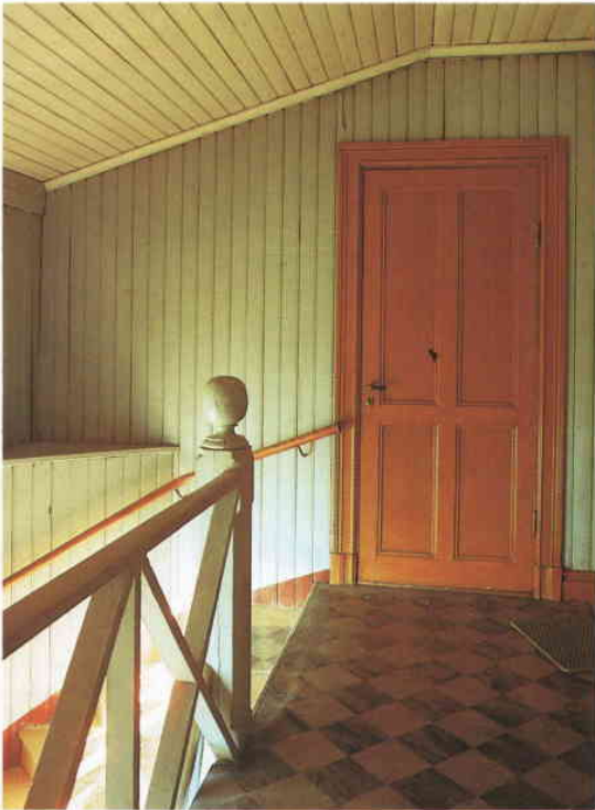
Utkiksbacken 17, det hus som revs 1980.