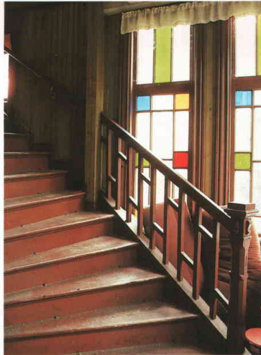
"Furuberg", Utkiksbacken 26.

Trappuppgångarna kan ha träpanelklädda väggar, räcken med svarvade dockor, kulörta fönsterglas eller bara en enkel målningsdekor. Inte sällan ter de sig som husets gemensamma finrum.