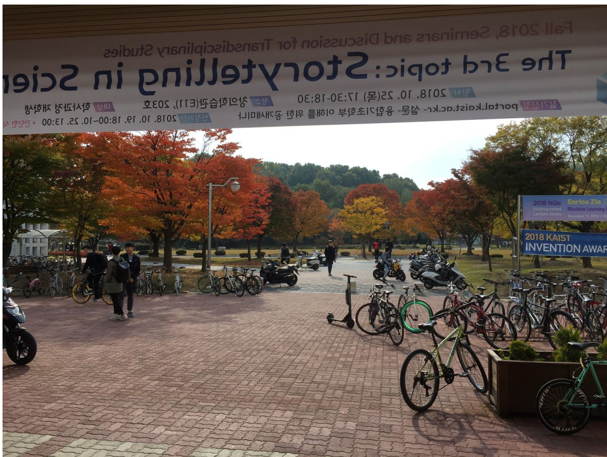
Foto taget från entré till byggnaden E11

Trevligt ställe att studera på under de varma månaderna på året, ligger nedanför biblioteket