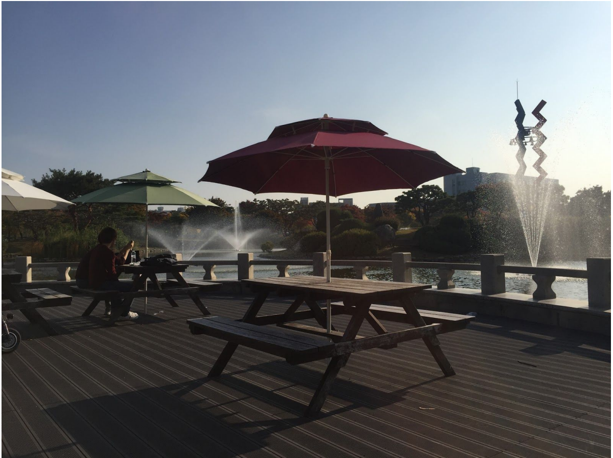
Vy över Daejeon, söndagskväll oktober månad