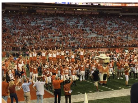
Texas VS West Virginia

Jag rekommenderar att ha minst ett besök till ett amerikanskt fotbollsspel. Det brukar vara ett väldigt stort event som drar i minst 10 000-tals människor både in- och utifrån universitetet. Då är man garanterad att få en glimt av den amerikanska kulturen.