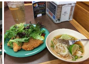
Kinsolving Dining Hall