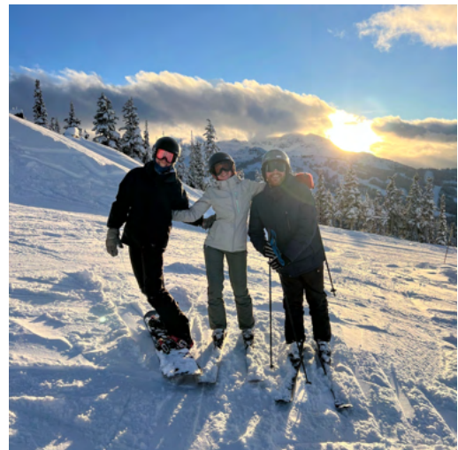
En bild från en härlig skiddag i Whistler