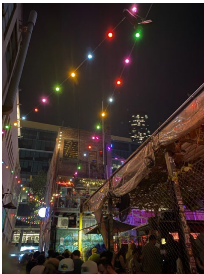
Partygränder i CBD

Melbourne är en galet cool stad, definitivt en av de finare och charmigare storstäderna jag har varit i. Det fanns stora kontraster i ett väldigt modernt CBD och äldre charmigare suburbbs. Det fanns mycket liv och kultur, och många häftiga klubbar och barer. Särskilt i början av terminen, mot slutet av sommarn, var det väldigt mycket som pågick med diverse event, karnevaler och konserter att besöka. Om man tar sig utanför innerstaden möts man även av väldigt häftig natur och massor av olika nationalparker, vilket vi ofta hyrde bil över en helg för att utforska. Rekommenderar starkt Great Ocean Road och Wilson Promontory.