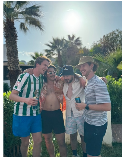
Bild från Sicilien, några kompisar från Nederländerna och Frankrike