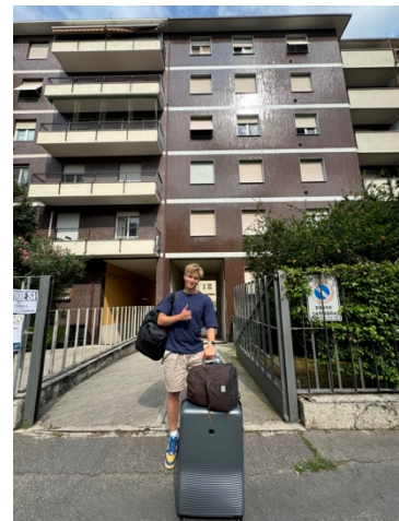
Utanför mitt boende i Città Studi

Boendestandarden var helt okej, men hyrorna i Milano kan vara höga. Jag lyckades hitta ett rum som var rätt bra och som hade AC, något som kan vara bekvämt att ha. Generellt sett är boendekostnaderna i Milano högre än i många andra europeiska städer, men det går att hitta prisvärda alternativ med lite sökande.