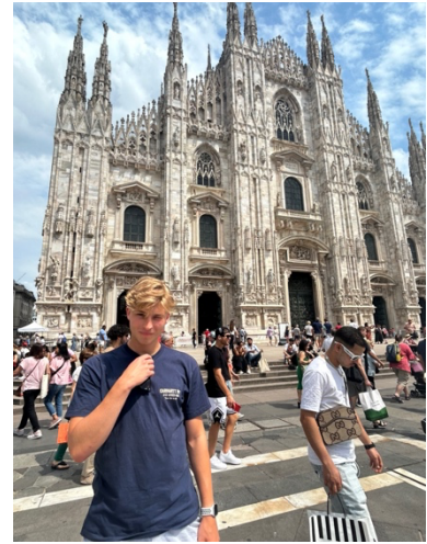
Utanför Duomo, en sevärdhet

Jag besökte också San Siro för att se flera matcher (5 st), inklusive Derby della Madonnina (AC Milan - Inter Milan). Utöver sport och sociala evenemang besökte jag många platser runt om i Italien och även