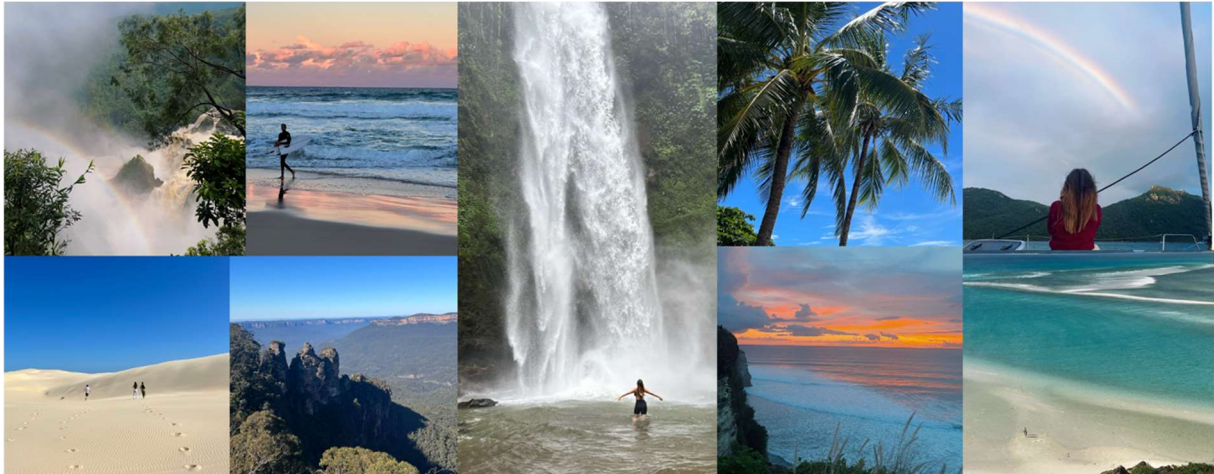
Bilder från resor