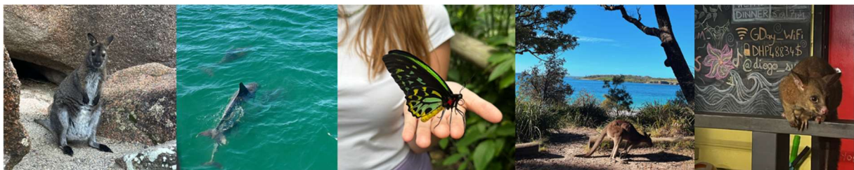
Några av alla gulliga djur som jag såg <3

Generellt sett är den australiensiska kulturen väldigt välkomnande och öppen, och även om Sydney är en stor stad hände det flera gånger att jag och mina vänner fastnade i konversationer med främlingar. Det var både en kulturkrock i början, och något som jag kom att uppskatta mycket, så pass att jag saknar det hemma. Sydney och Australien är en destination för dig som gillar både stad och strand, både bad och fantastiska naturupplevelser. Jag vet att många är rädda för att träffa på farliga djur i Australien, men det är inget som du behöver oroa dig för om du åker till en stor stad. Så länge du inte går off-trail, kollar var du sätter fötterna och lyssnar när badvakterna skriker i megafonen att du ska gå ur vattnet kommer du klara dig.