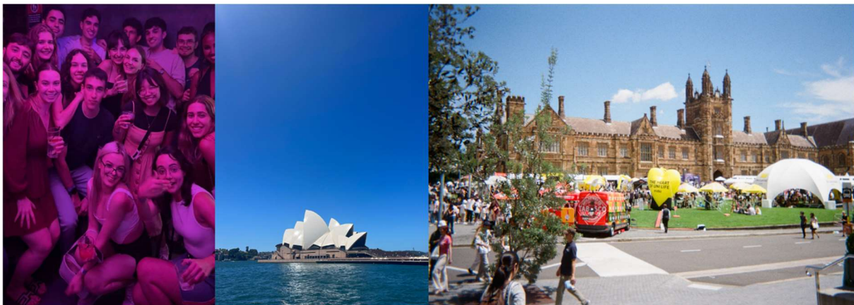
Bilder från ankomstveckorna i Sydney

Jag landade i Sydney ungefär 3 veckor innan kursstart och 1 vecka innan mottagningen började. Jag åkte med två andra KTH studenter som skulle på utbyte på USYD, vilket kändes väldigt tryggt. Vi hade boenden nära varandra och spenderade de första dagarna tillsammans med att vänja oss vid miljön och inreda våra lägenheter. Jag träffade väldigt snabbt andra utbytesstudenter via en utbytes-whatsapp-grupp och de första veckorna upptäckte vi Sydney och gick på mottagning tillsammans. Skolans mottagning var både för internationella och lokala studenter – alltså väldigt stor, och det fanns så många aktiviteter man kunde delta i. Vi utbytesstudenter blev också inbjudna till en ceremoni där vi hälsades välkomna av representanter från USYD och från urbefolkningen Gadigal-folket. Sammanfattningsvis var det väldigt lätt att ankomma som utbytesstudent då välkommandet var välorganiserat och varmt.