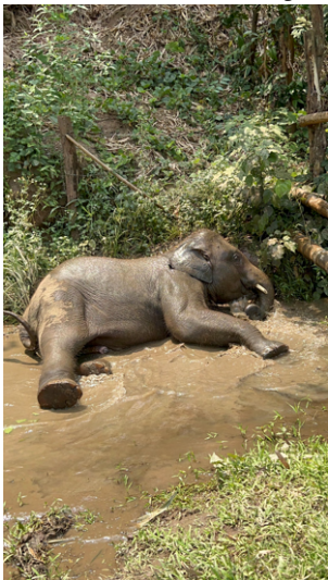
Chiang Mai, Thailand