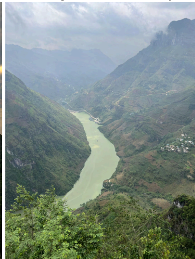
Ha Giang Loop, Vietnam