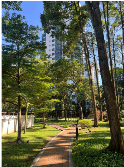
Parc Oasis Residences

Jag bodde utanför campus eftersom min ansökan inte blev accepterad. Jag rekommenderar att ni söker boende på campus men var beredda på att ni kanske kommer behöva hitta privat boende. Det är upp till en själv att söka boende så se till att göra det i god tid. Min hyra var 1350 SGD (ca 10700 SEK) samtidigt som jag bodde med 5 andra rumskamrater, så det är inte billigt att bo utanför campus. Jag hade däremot ett ganska stort privat rum och i bostadsområdet har du tillgång till en pool, gym och tennisbana. Jag hittade boende med hjälp av en mäklare som brukar hjälpa svenska studenter i Singapore. Hör gärna av er till mig om ni vill ta kontakt med henne!