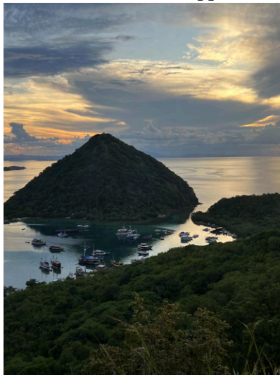
Labuan Bajo, Indonesien