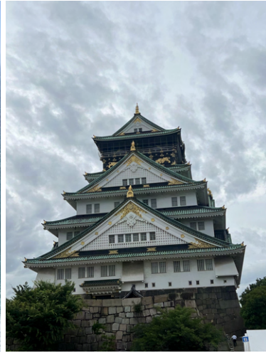
Osaka Castle, Japan