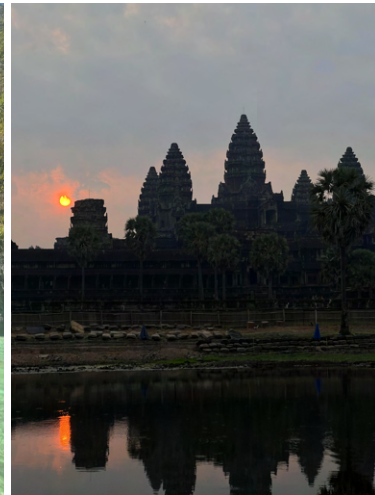
Angkor Wat, Kambodja