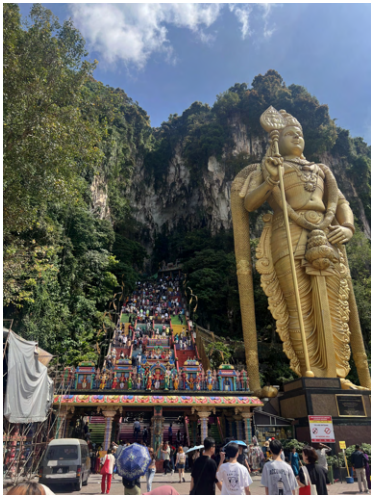
Batu Caves, Malaysia

Res mycket! Skolan är självklart viktig och borde prioriteras, men ta verkligen vara på denna chans och utforska så mycket som möjligt. Nedan är några av mina favoritbilder jag tog under mina resor.