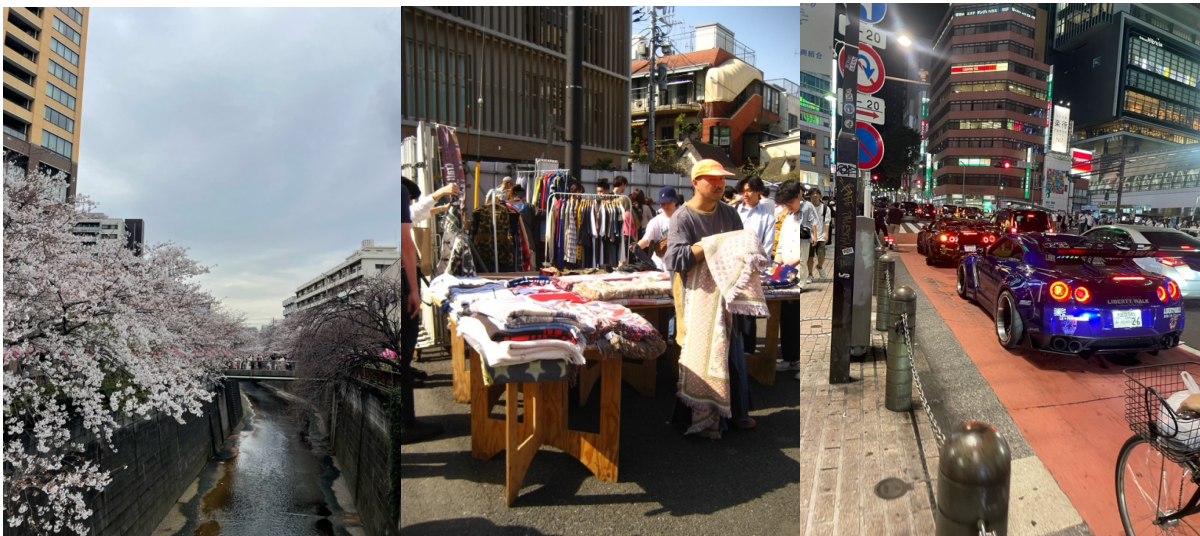
Nakameguro, Shimokitazawa and Shibuya

Jag ordnade mitt boende innan avfärd genom skolan. Skolan har flera alternativ på boende på lite olika ställen i Tokyo. Jag lyckades få ett korridorsrum med eget badrum (delat kök) på Komaba Lodge (har tyvärr inga bra bilder på boendet men sök på Komaba Lodge på Google) som ligger precis bredvid ett av campusen (Komaba Campus). Det ligger endast ca 20 minuters promenad eller 5 minuter med tåg från Shibuya, och även nära många andra coola områden som Shimokitazawa, Ebisu och Nakameguro. Nackdelen med boendet är att det tar ca 1h att ta sig till det andra campuset som heter Hongo så om man vet att man ska ha många kurser eller vara där mycket kanske det kan vara värt att se över andra alternativ. Jag var dock otroligt nöjd med boendet på grund av läget (nästan oslagbart), att jag hade majoriteten av mina kurser på Komaba Campus, och att personalen på boendet var väldigt trevliga och hjälpsamma. Man träffade även många andra utbytesstudenter på boendet.