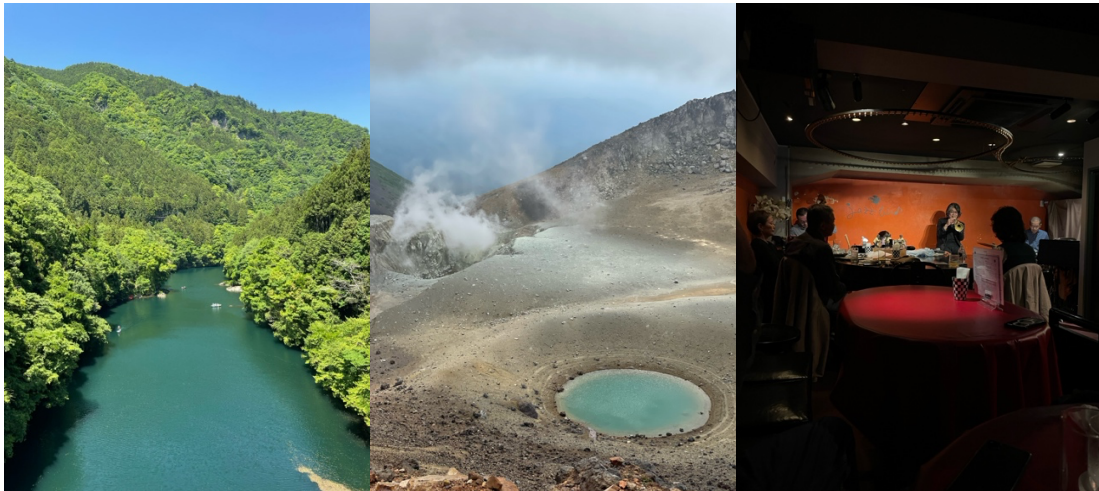
Okutama, Hokkaido och en jazzbar i Tokyo