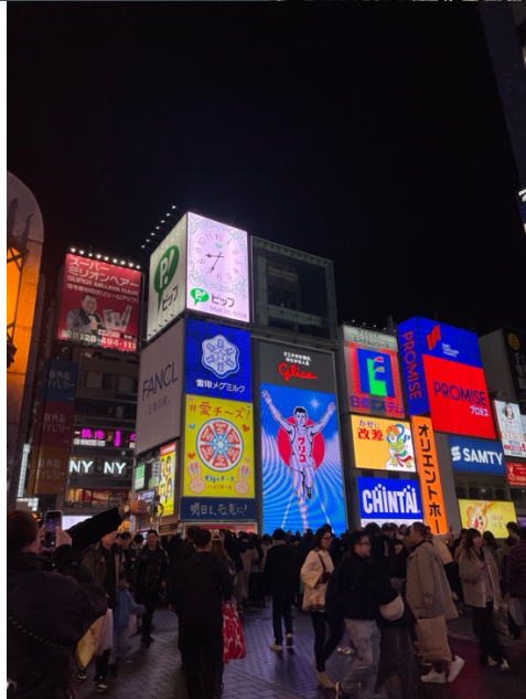
Mt. Fuji, Kyoto och Osaka