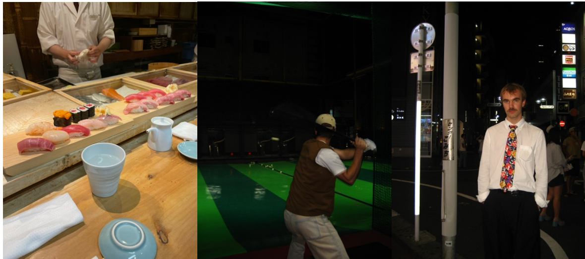
Sushi på Tsukiji Market, Baseball i Shinjuku och Karaokekväll i Shibuya