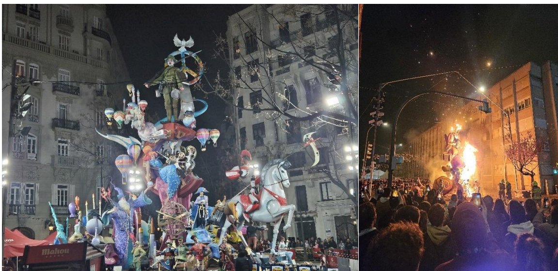
Two olika fallas, varav en brinner

En tid som jag hade turen att få uppleva i och med att mitt utbyte var under våren var Las Fallas. Denna stadsfestival påbörjades med fyrverkerier och smällare den 1a Mars och pågick i nästan tre veckor fram tills den 19e Mars. Under tiden hölls det dagligen fyrverkerishower och så kallade "Masclatá" vilka är organiserade uppvisningar med starka smällare. Stadsborna samlas under denna tid i sina "Fallas" eller "Barrios", alltså grupper baserade på vilket kvarter man bor i, och organiserar uppförandet av en Falla vilket är en stor Papier-maché-staty. Från och med den 15e mars är de flesta lediga, inklusive vi universitetsstudenter, för att hinna se så många av dessa statyer som möjligt och för att avsluta Las Fallas ordentligt. Under Las Fallas sista kväll bränns alla statyer vilket för många stadsbor blir ett känslösamt avslut på ett års arbete.