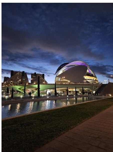
Palau de les Arts Reina Sofia i Ciutat de les Arts i les Ciències

Min fritid spenderade jag oftast på något sätt med de vänner jag fått från intensivkursen i Gandía, via mina kurser eller från annat håll. I och med det stora utbudet av sport på campus fanns det nästan alltid något fysiskt engagerande tillgängligt, exempelvis gym, padel, crossfit etcetera under dags- och kvällstid. Utöver faciliteterna på campus fanns även en löpbana i Turiaparken och beach volleyball vid stranden. Både Turiaparken och stranden är för övrigt värda att besöka om och om, vilket blir oundvikligt vid ett utbyte i Valencia. Här rekommenderas även Ciutat de les Arts i les Ciències som ligger vid ena änden av Turiaparken.