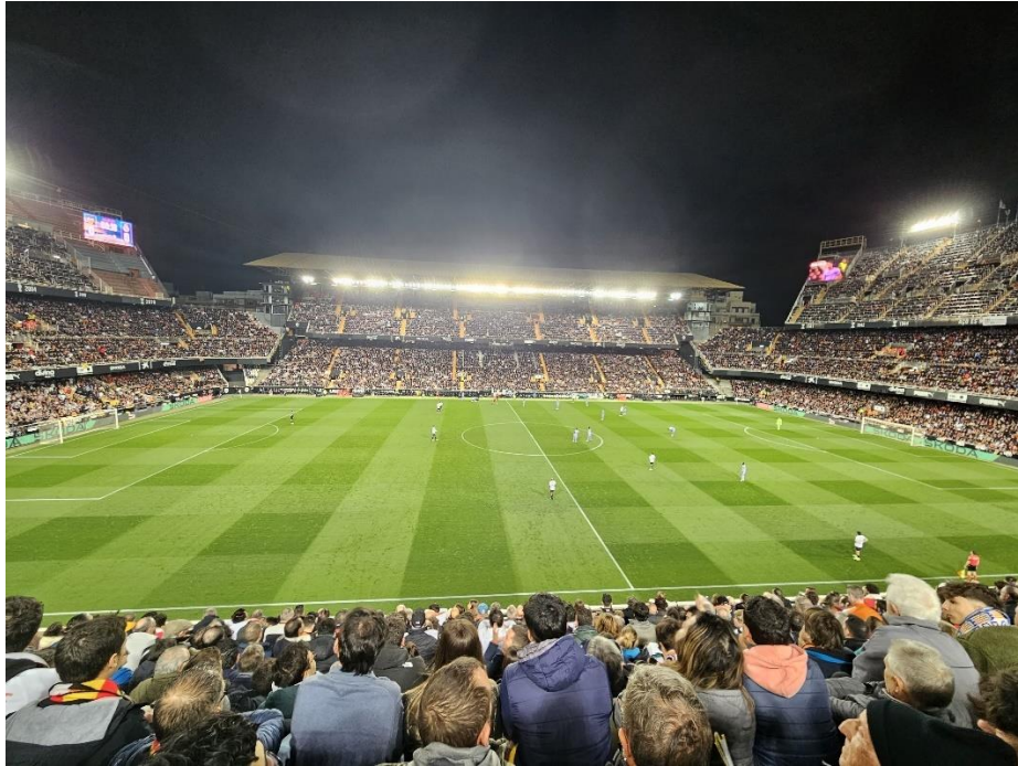
Mestalla: Valencia CF – Real Madrid CF

För den fotbollsintresserade skulle jag även rekommendera att besöka den gamla och anrika fotbollsarenan Mestalla där Valencia CF spelar. Själva hade jag turen att kunna besöka arenan under matcher mot klubbar som både Sevilla FC och Real Madrid CF då hemmalaget i alla fall under mitt utbyte spelade i Spaniens högsta liga, La Liga.