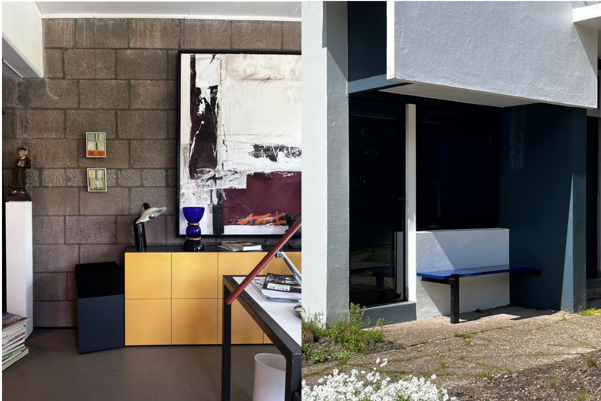
Bilder från platsbesök Herman Hertzberger, Diagoon housing och Gerrit Rietveld, Schröder House

30% av landets yta ligger under havsnivå, stora delar av markarealen är täckt av åkrar och växthus, däremellan kanaler. När man gräver i marken är det bara sand... vad enkelt det är att göra markarbeten då, kommenterade en av våra besökare som jobbar inom anläggning.