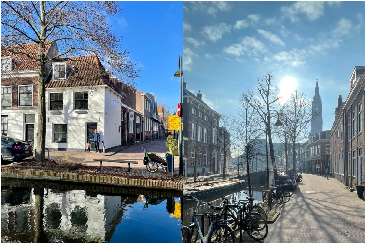
Vårt hus vid kanalen i februari. Verwersdijk, runt hörnet där vi bodde, en typisk kanalgata i Delft.

Om du reser ensam så kan skolan fixa bra boende åt dig, läs om det i de andras reseberättelser.