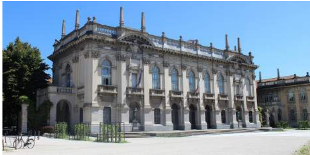
Huvudingången för campus Leonardo

föreläsningar, seminarier, projekt och tentor. Eftersom jag går masterkurser hölls allt på Engelska så språket var inga problem. En vanlig dag kunde bestå av föreläsningar på morgonen, möte med någon projektgrupp och sen lite eget arbete på uppgifter.