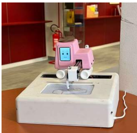
Vår "ritarrobot" som vi designade. Den ritar bara när det är tyst och blir arg när det är för mycket ljud.

Robotik och Design (093217) var en supernajs projektkurs där några designers och ingenjörer slås ihop till en grupp för att designa och bygga en robot som ska lösa något speciellt problem, i vårt fall hur man fick folk att vara tystare i biblioteket.