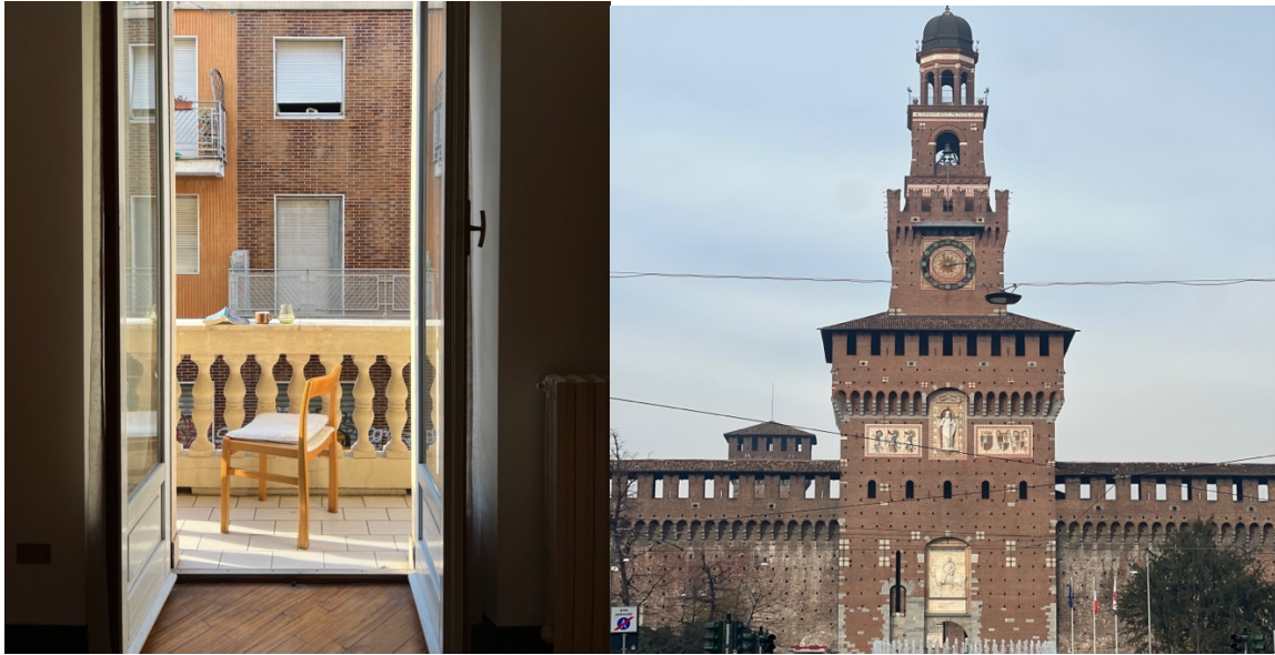
Bild på min balkong, Castello Sforzesco nära jag bodde.