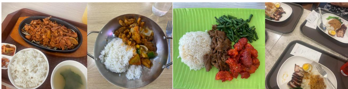
Typiska måltider. Chaw Siew Rice som visas på sista bilden måste ni testa!

I övrigt finns det en hel del att se och göra i Singapore, något som passar alla. Fina grönområden och promenadstråk, nattliv med alla möjliga klubbar och barer, massvis av restauranger, nöjesparker, strand, museum, utställningar osv. Något intressant med staden är att det finns två områden, China Town och Little India, där kulturen skiljer sig från resterande Singapore. Det känns precis som att du hamnar i något litet område mitt i Kina eller Indien där atmosfären, människorna och maten är annorlunda. Jag åkte aldrig till Little India då många som åkt dit inte tyckte det var någon höjddare, men har ni mycket tid i Singapore är det säkert värt att se det.