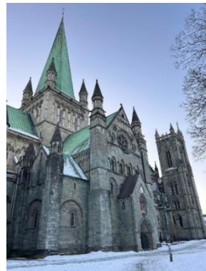
Landmärkena Nidelva vid Gamle Bybro, Kristiansten Festning och Nidarosdomen.