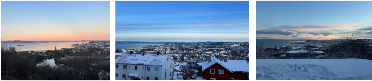
Min utsikt från trädgården och villaområdet.

rekommenderas det att kolla på bostad genom SIT. Det är en studentorganisation som erbjuder bland annat studentbostäder i form av möblerade och omöblerade lägenheter men även studentkorridorer.