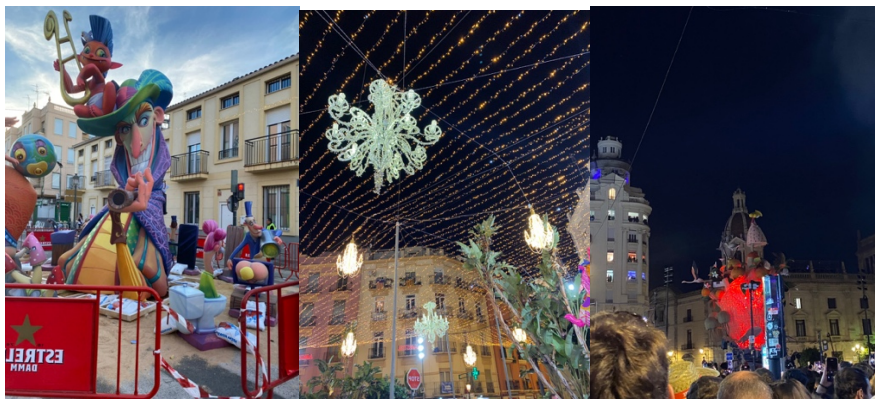
De större konstverken, varav det största konstverket som var ett hjärta som tändes eld på sista dagen och hur de dekorerade staden.