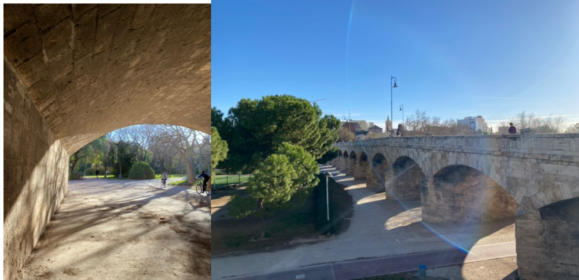
Bilder från field tripen runt Valencia med kursen Art and estetics in civil engineering

Integración y Modelado de la Información en la Construcción (BIM) – Jag började gå den här kursen men eftersom den var på spanska blev den lite för svårt för mig samt krockade med en annan kurs jag gick så jag valde till slut att hoppa av den.