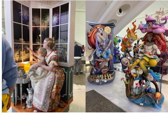
Några mindre konstverk som ställdes ut på museet.