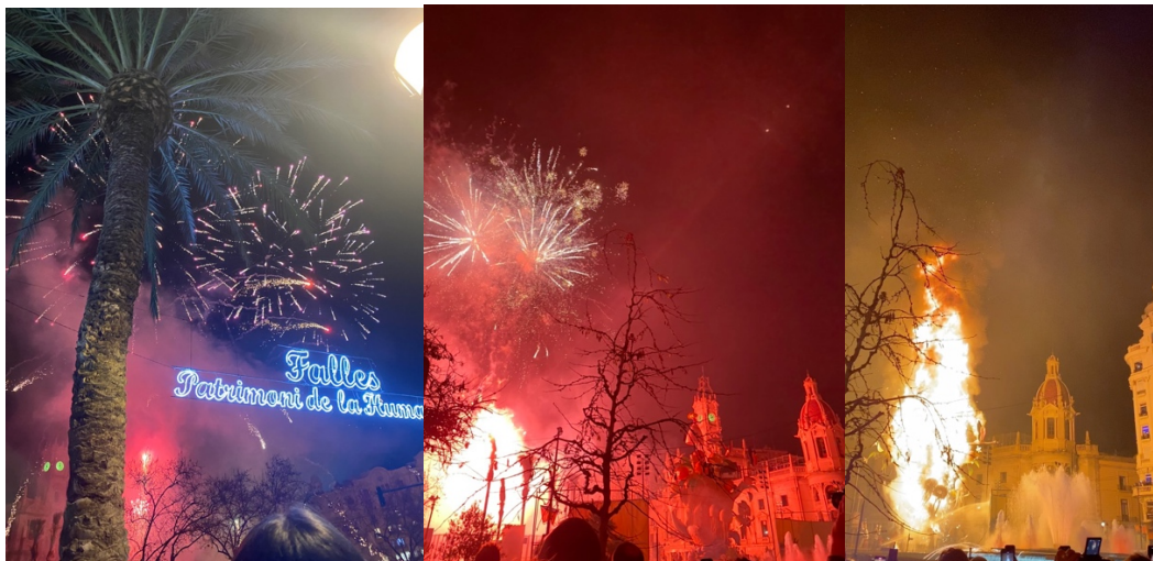
Den sista fyrverkerishowen och det största konstverket som brann upp.

Valencia hade även flera andra mindre högtider och eftersom det ligger så centralt i landet var det enkelt att resa runt i Spanien. Det var ca 4 timmar till Barcelona och 4-5 timmar till Andalusien dit många reste runt.