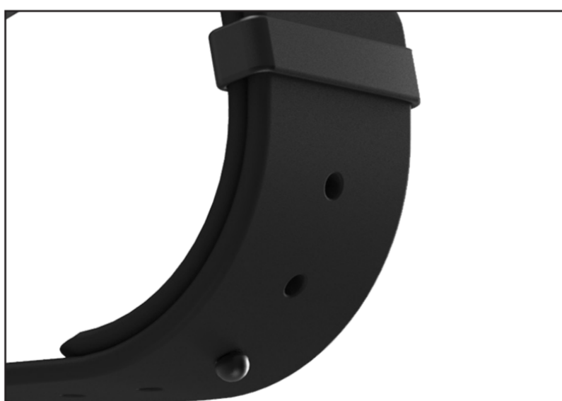
Klockans spänne och armbandsfäste