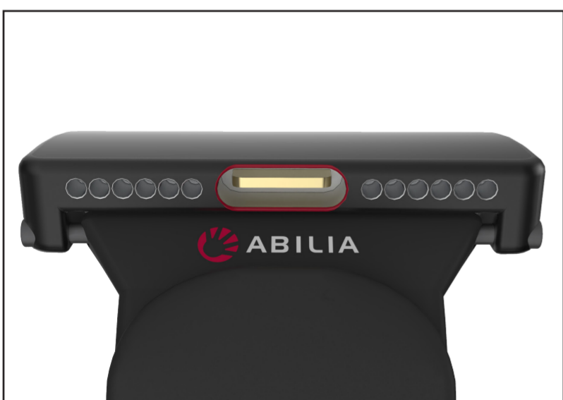
Bottensidan med USB-C uttag och högtalare