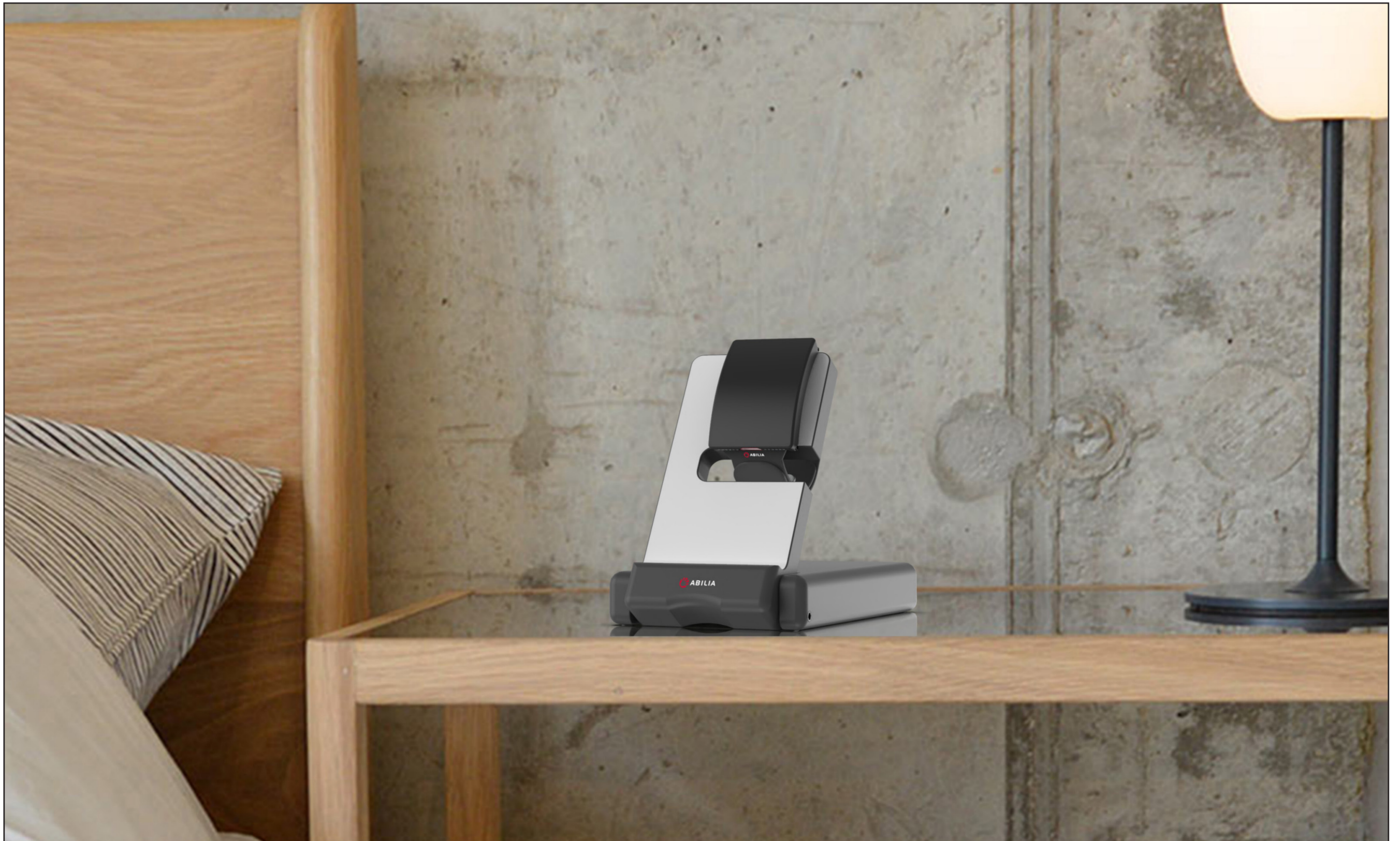
Klockan med laddstation placerad på ett nattduksbord