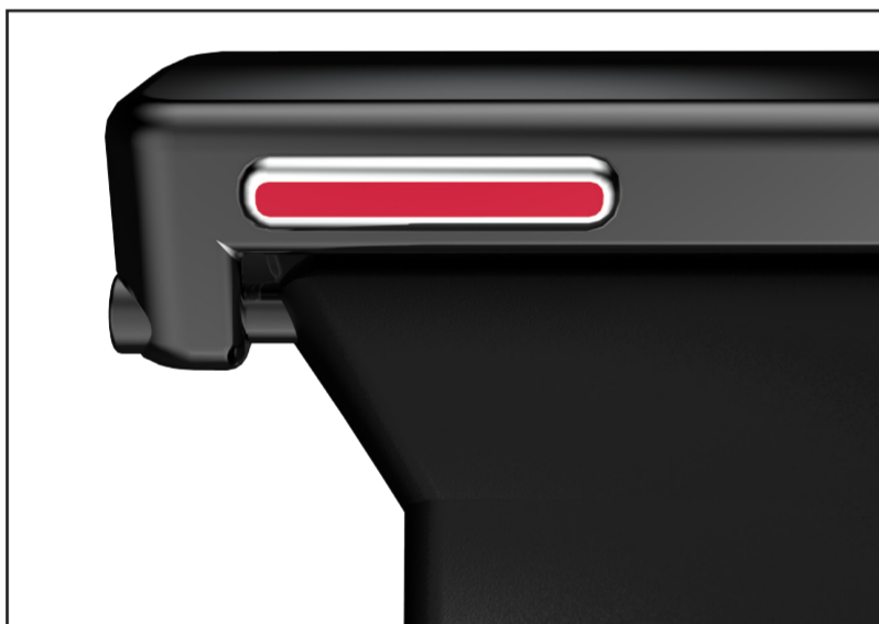
Start- och låsknapp