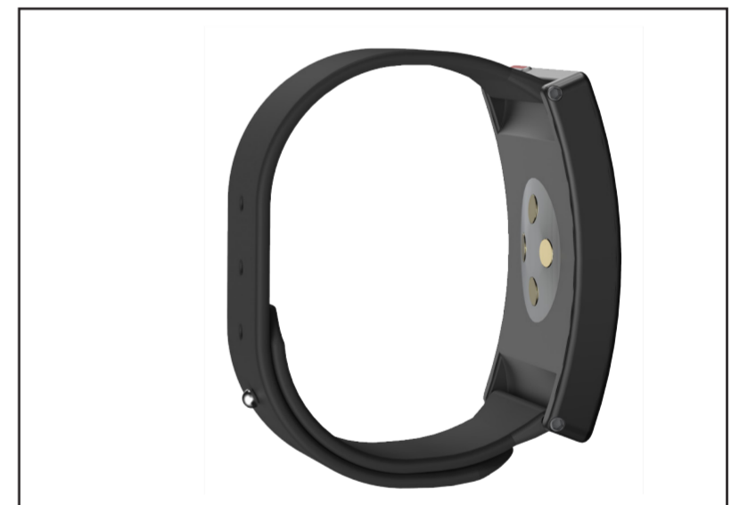
Armbandets kurvatur framhävs